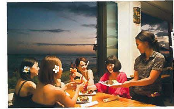
右:ワンピース¥18,800(シェルショア) その他(すべて本人またはスタイリスト私物)

ハワイで食べたいグルメの上位にステーキがランクイン。滞在中1日は、ステーキやシーフードを自分好みにグリルできるワイキキビーチ沿いのショアバード・レストランへ。